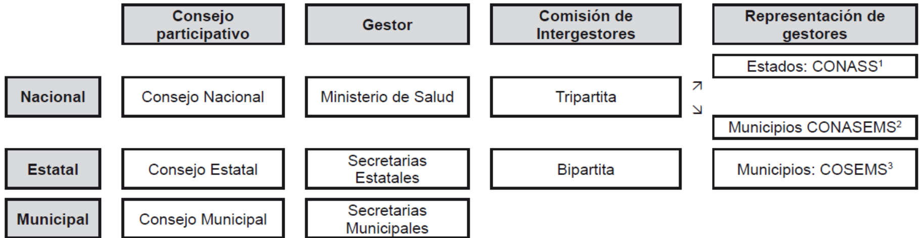
Figura 1. Estructura institucional y de decisión en el Sistema Único de Salud del Brasil (28) .