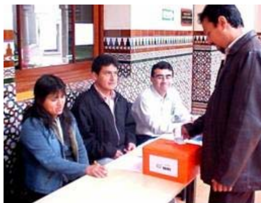
Proceso electoral de ABINS en sede central del INS