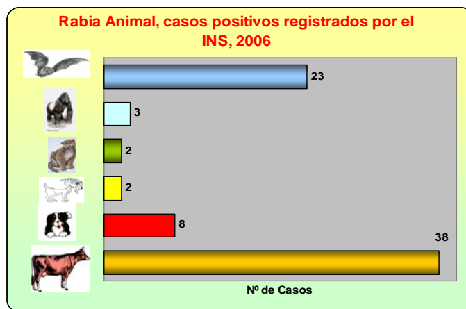
Fig. Nº 2

La figura 2 presenta los casos positivos que se procesaron en el INS, en lo que va del presente año, según tipo de especie.